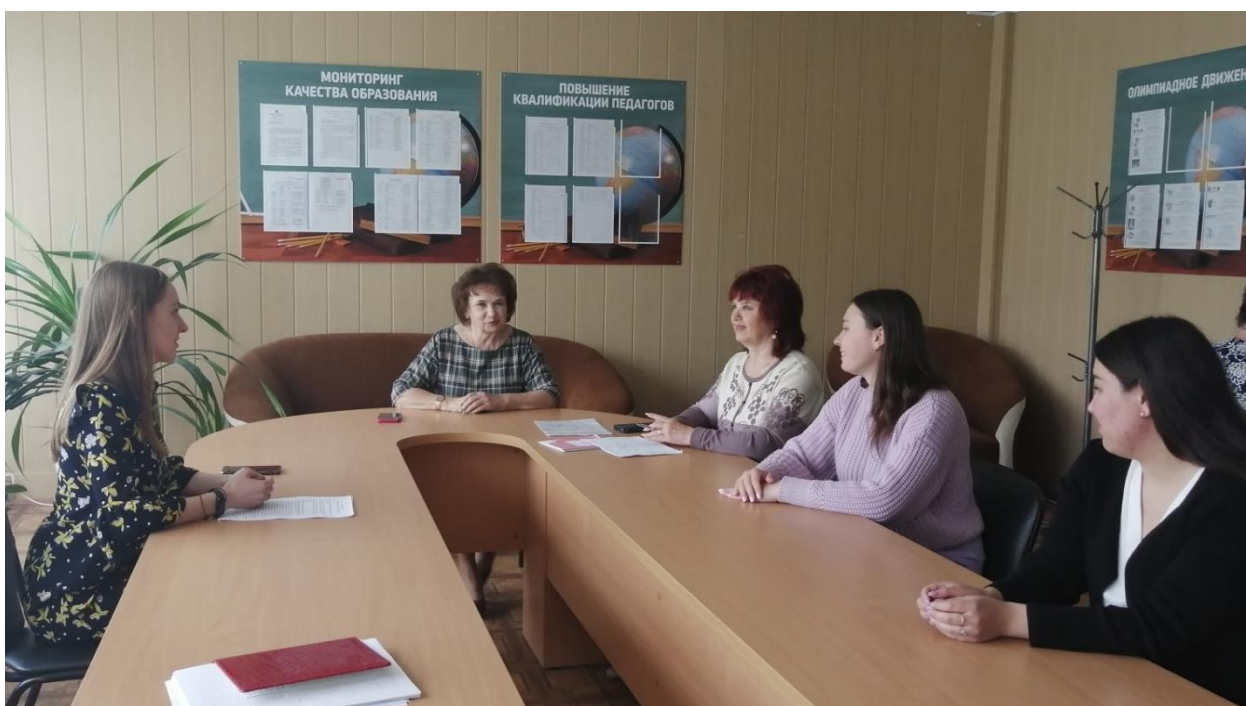
Заседание школы молодого специалиста.